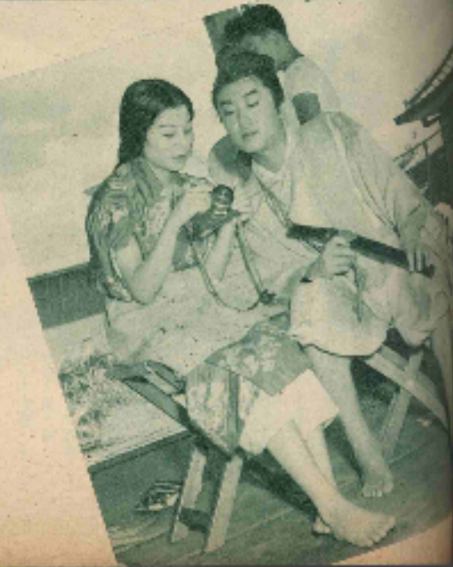
「恋」のセットで、口監督と木暮、村さんほかはワイルド・スタイルで装束。いっしょに口さんは髪型とメイクの仕上げです。