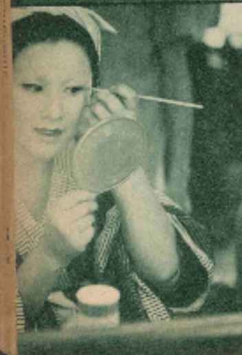
「恋」のセットで、口監督と木暮、村さんほかはワイルド・スタイルで装束。いっしょに口さんは髪型とメイクの仕上げです。