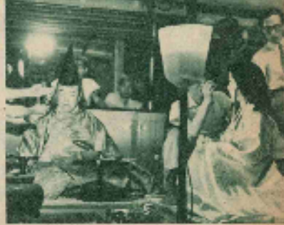
明治の時代劇に浴衣姿合せに美穂の杉さん ◎これは朝晩の映画にマリアの近力が高くて