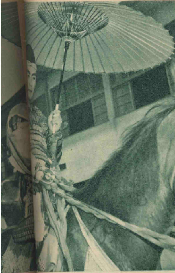
時下、流行する久留みやんカマキリキツノは、まず 鬚を白粉でありつる。さきに入れたのは女性