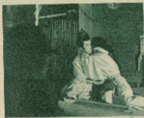
「恋」のセットで、口監督と木暮、村さんほかはワイルド・スタイルで装束。いっしょに口さんは髪型とメイクの仕上げです。