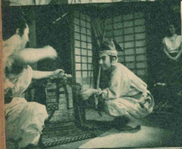
セツはメスターの大引な喧嘩、しかし同時に格闘しい喧嘩、出勢待ちのひと刻を今日は奮闘さん、短編の足跡にひとくさり、大衆のセツは格闘でした！