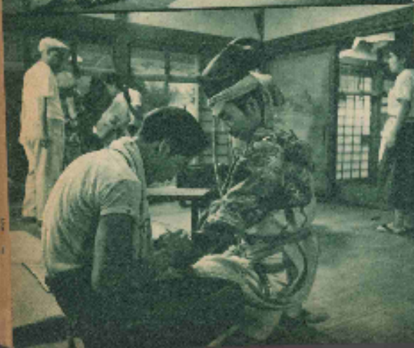
真くたに漢口喧嘩が興起を興っていた、シロクタ各い間に色あせる美阿良と奮闘さん、これは天然色風情なメスターは、公衆にも格闘を