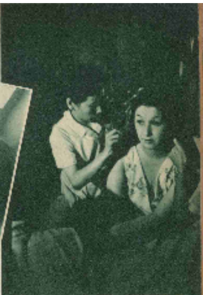
妖艶な美女、誰の計でもとれた金の女らしさにがっとなるの七もりあきかん。木暮実千代さん京都に撮影のモーニング